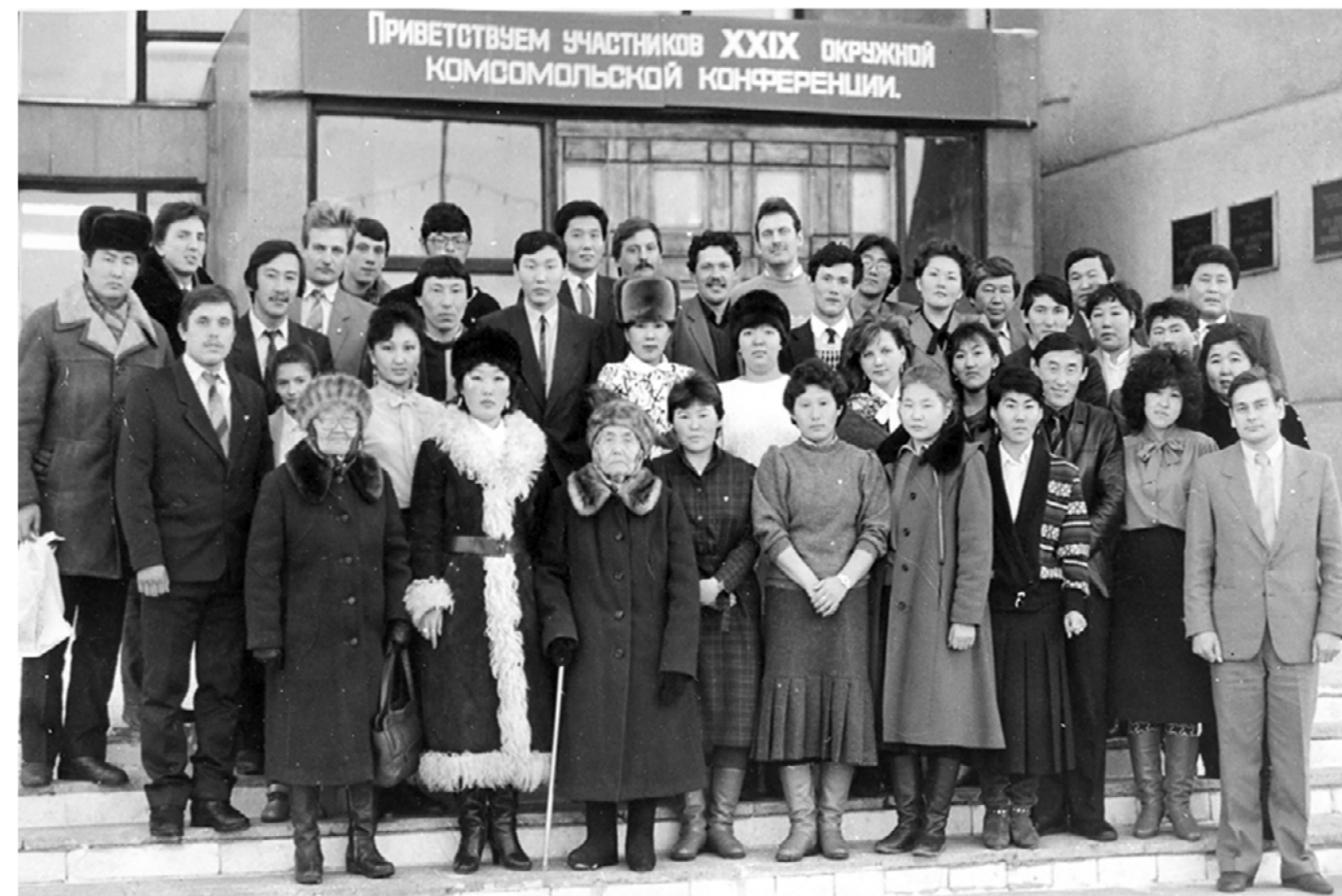
Приветствуем участников XXIX окружной комсомольской конференции.