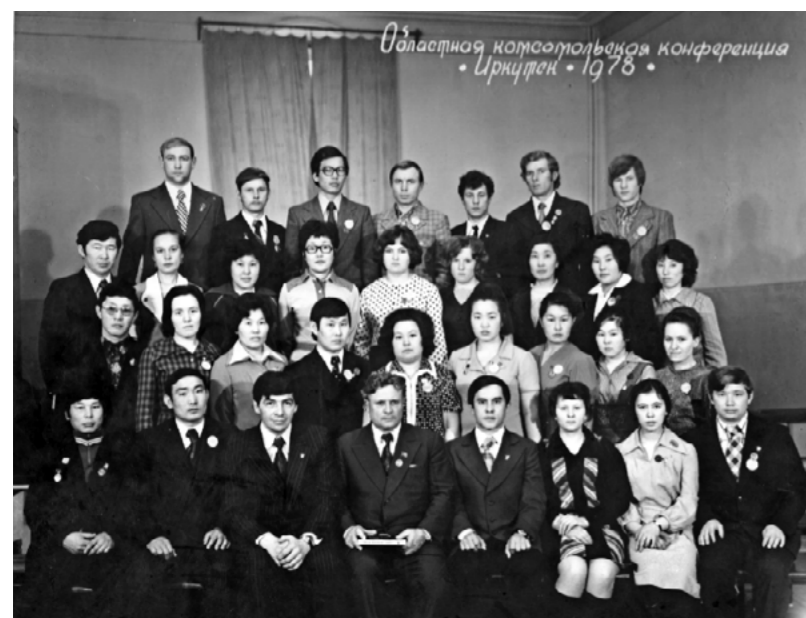
Областная комсомольская конференция, 1978 г.