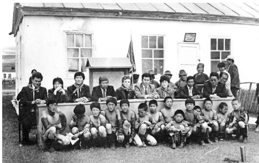
Комсомольцы округа в Монголии, 1985 г.