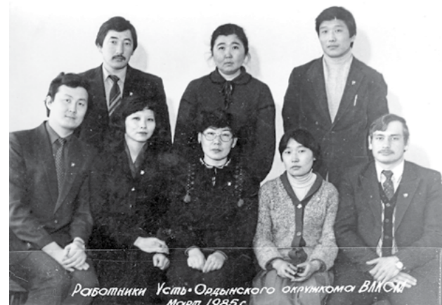
Работники Усть-Ордынского окружного ВЛКСМ Март 1935 г.

Создан в октябре 1937 г. в связи с образованием в составе Иркутской области Усть-Ордынского Бурят-Монгольского национального округа, объединив три аймачных комитета ВЛКСМ – Аларский, Боханский и Эхирит-Булагатский.