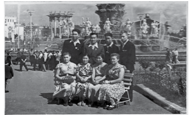
На Всемирном фестивале