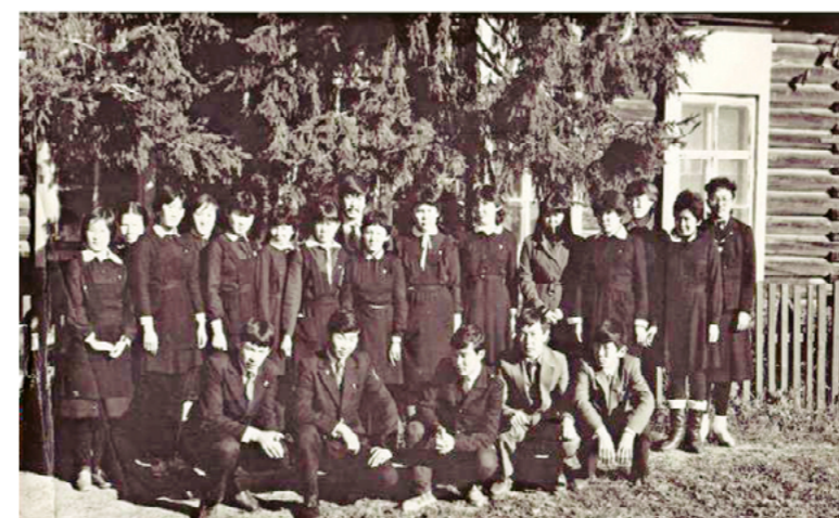
Выпускники Корсукской средней школы