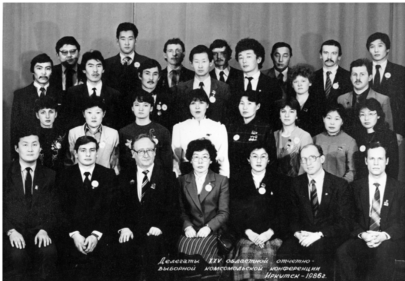
Делегаты XXV областной отчетно-выборной комсомольской конференции Иркутск - 1986г.