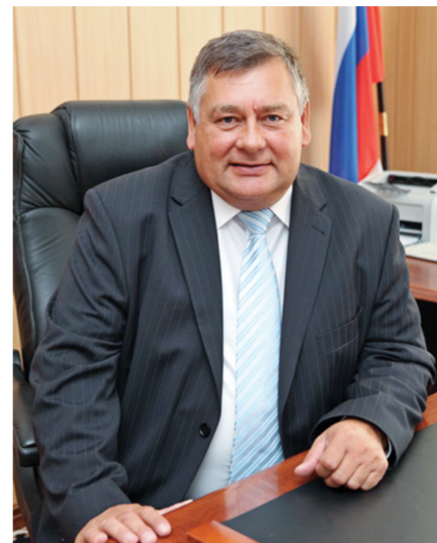
Уважаемые земляки! Дорогие комсомольцы всех поколений!

С уважением, Губернатор Иркутской области С. Г. Левченко