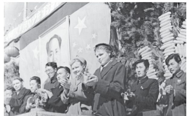
С дружественным визитом в Китае