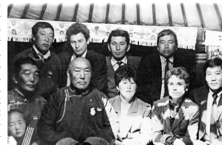
Комсомольцы округа в Монголии, 1985 г.

/Панорама округа. – 1998. – 28 окт. – С. 2./