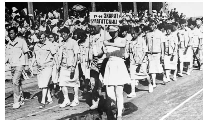
Команда Эхирит-Булагатского района на окружном КСП «Сур-Харбан – 1980»