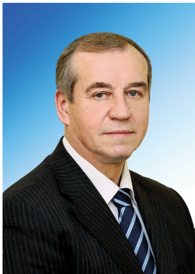
Уважаемые жители Иркутской области! Дорогие ветераны комсомола!

От всей души поздравляю вас со 100-летним юбилеем Всесоюзного Ленинского Коммунистического Союза Молодежи!