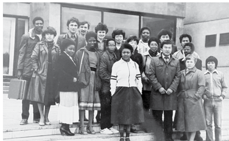
Встреча проходила за «круглым столом» с обменом интереснейших опытов работы с обеих сторон