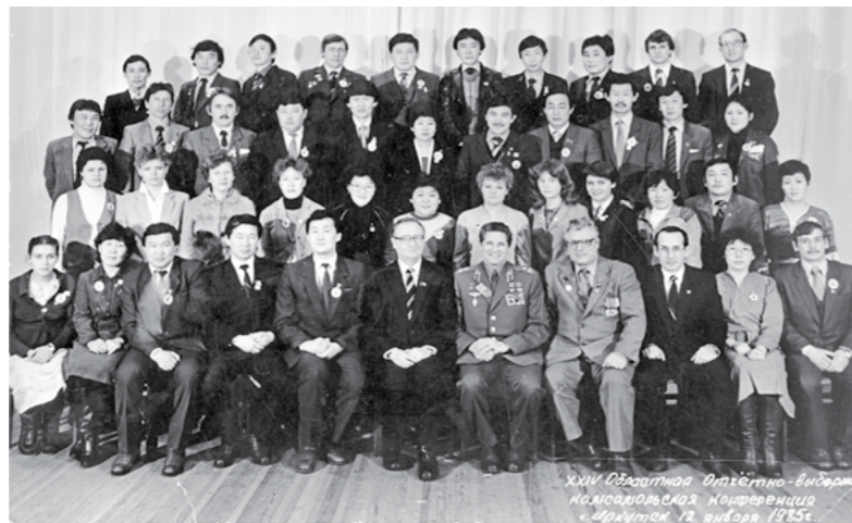
XIII Областная отчетно-выборная комсомольская конференция г. Иркутск 12 января 1938 г.

Прошедшие отчетно-выборные собрания в комсомольских организациях аймаков округа в 1938 г. показали