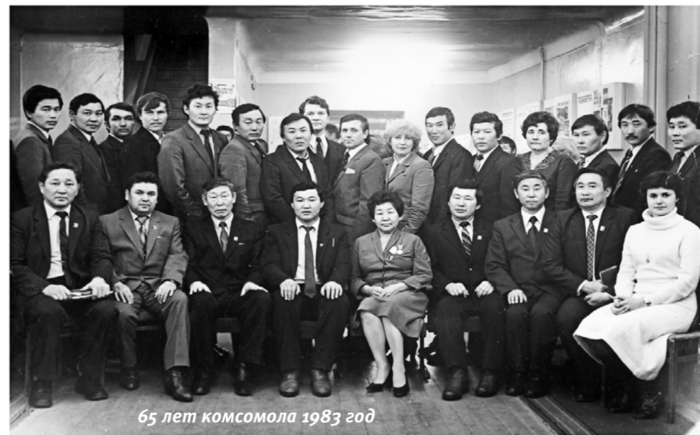
65 лет комсомола 1983 год