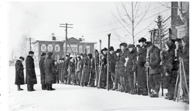
Окружная зимняя спартакиада, 1958 г.