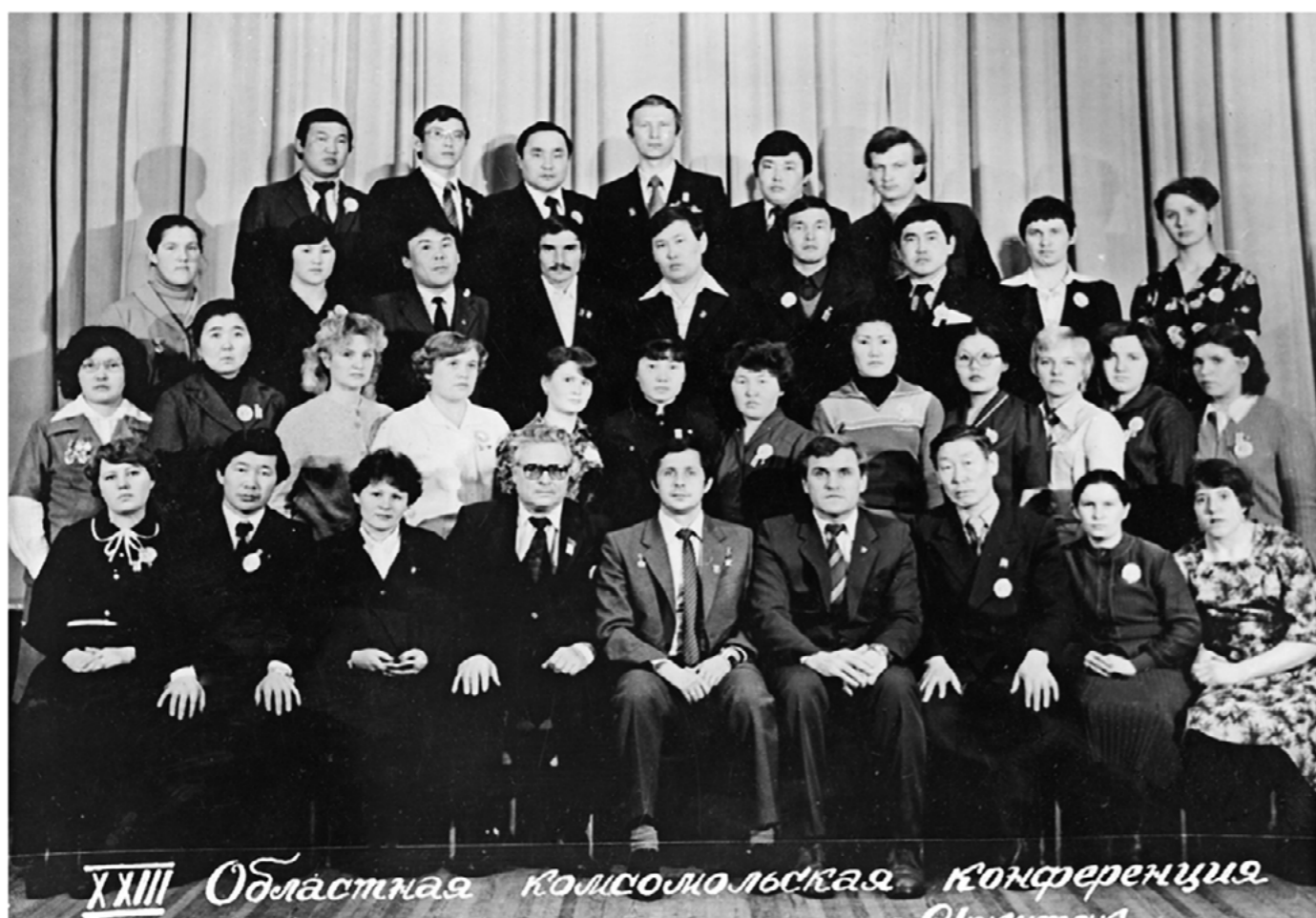
XXIII Областная комсомольская конференция Оймякон