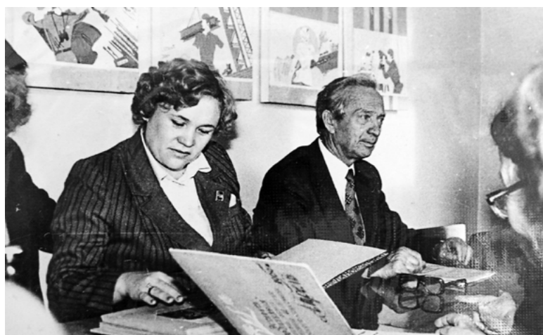
Встреча с представителями областного Совета ветеранов, 1981 г.

Школьные комсомольские и пионерские организации уделяли внимание трудовому воспитанию учащихся, проведению летней трудовой четверти, акции «Солидарность». Пионеры участвовали во Всесоюзном марше пионерских отрядов. Работали комсомольские педагогические отряды.