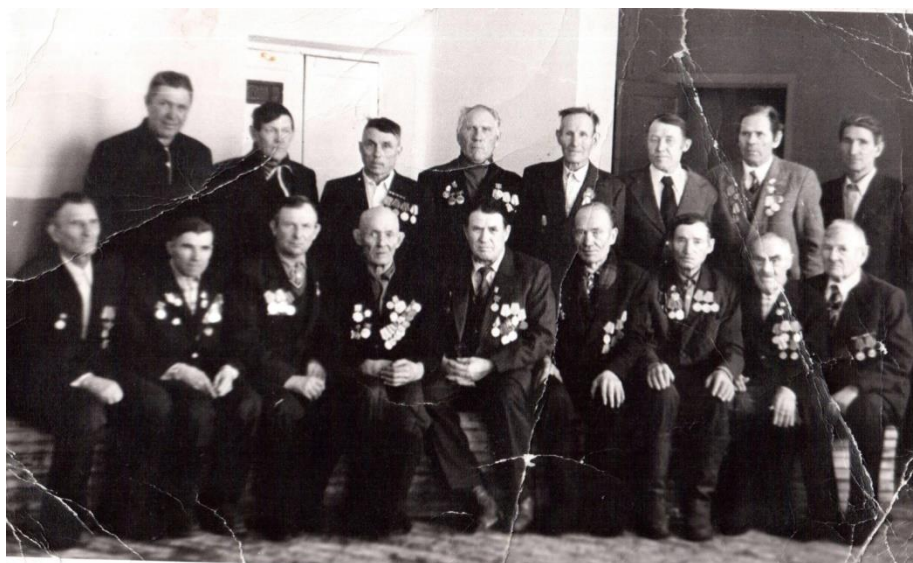
Ветераны Великой Отечественной войны пос. Ангарский. Фото 1985 г.

Судьба односельчан очень схожа с судьбой героев повести Валентина Григорьевича Распутина «Прощание с Матёрой». Точно так же им пришлось бросить обжитые места, разрушить родные дома. На дно реки ушли дивные, благословенные места. Как же тяжело было людям расстаться со своей родной стороной, где прошли юность, детство, где остались могилы близких! Как же трудно было смотреть на колыбель своего детства последний раз, стараясь запомнить всё до мелочей и знать, что больше ты этого никогда не увидишь! Всё останется лишь в памяти, да будет приходить во снах.