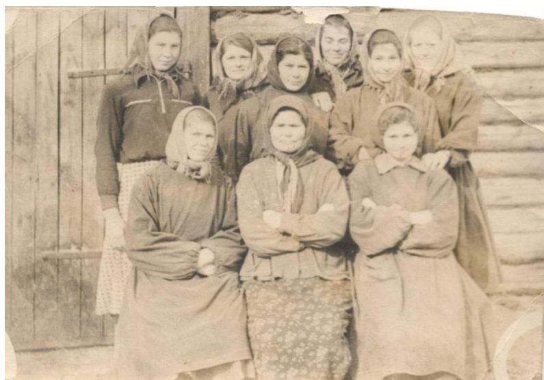
Доярки д. Мучная Степь. Фото 1955 г.

28 ноября 1961 года состоялось торжественное открытие первого гидроагрегата Братской ГЭС. На открытие прилетел генеральный секретарь Коммунистической партии Никита Сергеевич Хрущев.