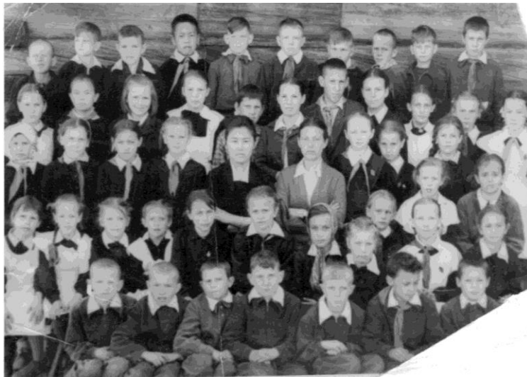
Ученики начальной школы д. Русский Нельхай. Фото 1959 г.