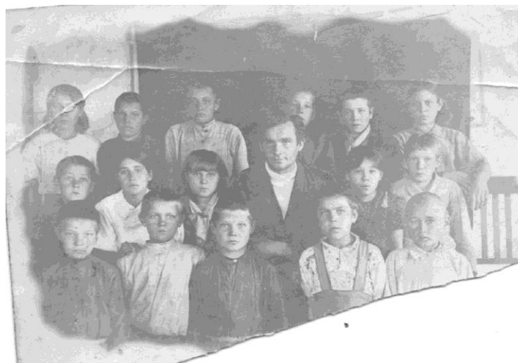
Ученики начальной школы д. Мучная Степь. Фото 1946 г.