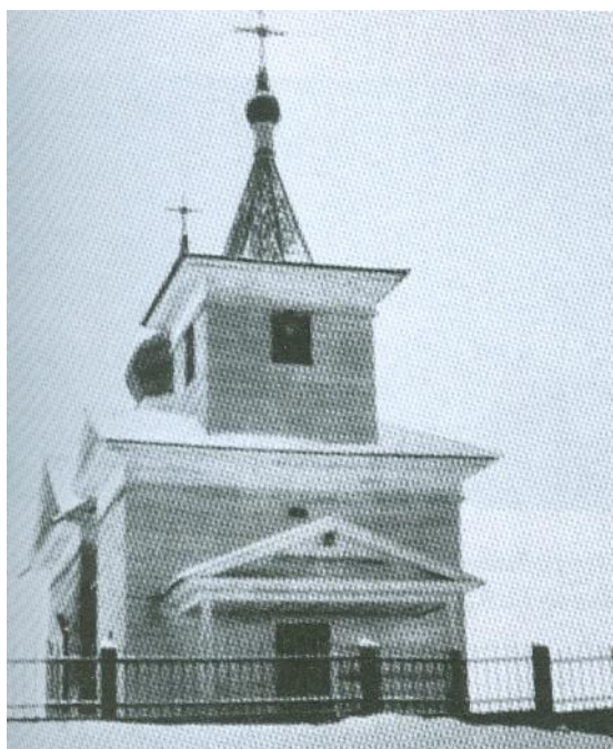
Николаевская церковь в улусе Нельхай. Фото начала XX в.

Недалеко от новой деревни Русский Нельхай до 1900-х г. существовал бурятский улус под названием Нельхай, в нем была церковь Николая Чудотворца. 11 июля 1874 г. на возвышенности у реки Ангары иркутский епископ Вениамин освятил закладку этого храма. Ставилась церковь на пожертвования купца И. И. Базанова, который кроме церкви устроил ещё дом для священника-миссионера, надворные постройки и училище 6 .