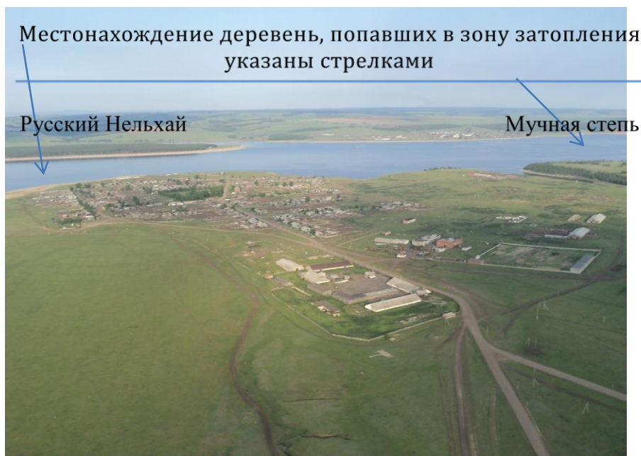
Посёлок Ангарский. Фото 2013 г.

«Родители» нашего посёлка – деревни Русский Нельхай и Мучная Степь попали в зону затопления и остались на дне рукотворного моря. Но история посёлка Ангарский берёт своё начало с возникновения именно этих двух деревень.