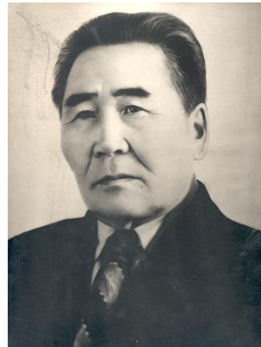
ШАДАЕВ АПОЛЛОН ИННОКЕНТЬЕВИЧ (1902 – 1969 гг.)