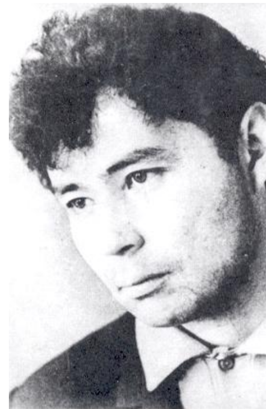
ВАМПИЛОВ АЛЕКСАНДР ВАЛЕНТИНОВИЧ (1937 – 1972 гг.)